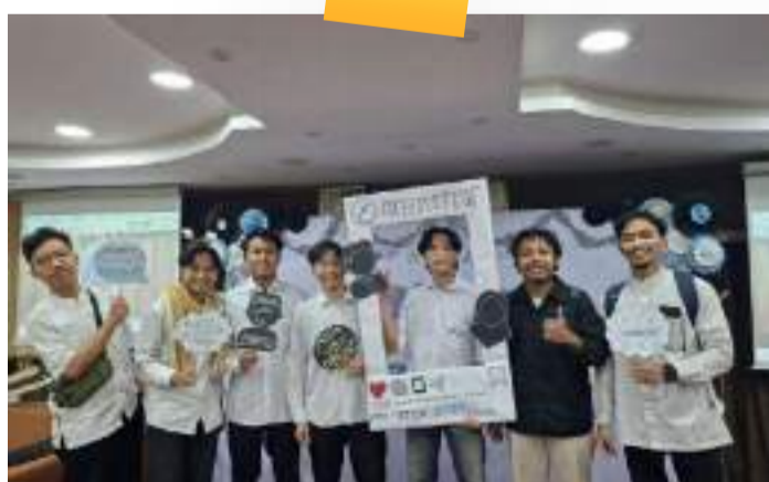
Forum Azhari Muda