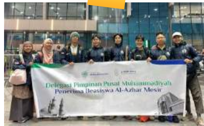
Kedatangan Kloter Kedua