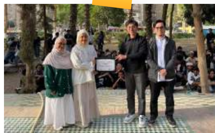
Pemilihan Ketua Angkatan