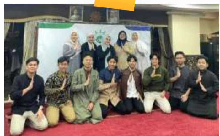
Pembinaan Bulanan Rutin