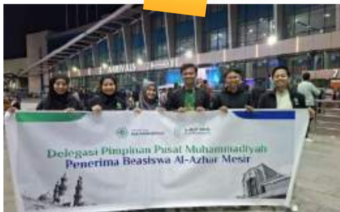
Kedatangan Kloter Pertama