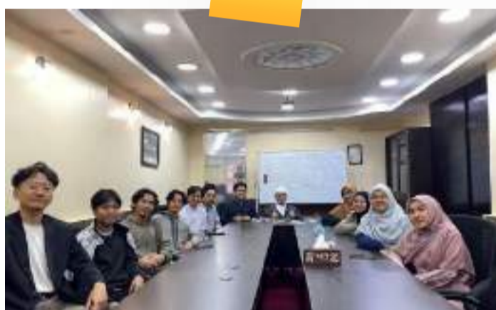
Kajian Kitab Pekan